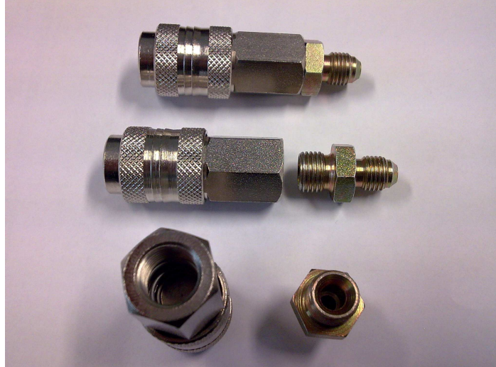
Ansichten der Schnellkupplung am KoolKare Stickstoff-/Formiergasanschluss