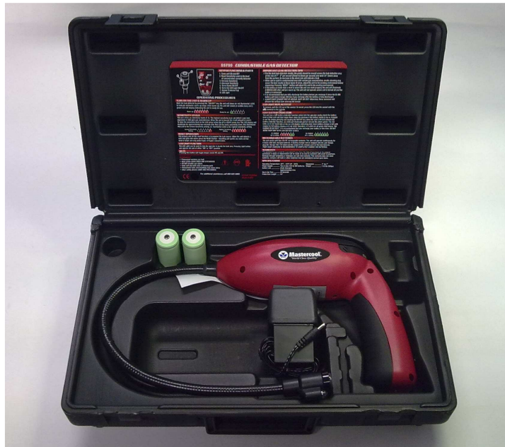
El. Formiergas Lecksuchgerät GS 4000

Die Handhabung des Formiergas-Lecksuchgerätes ist denkbar einfach. Die LED Reihe zeigt den, aus dem Leck austretenden Wasserstoffanteil des Formiergases an. Die Empfindlichkeit kann über zwei Tasten reguliert werden.