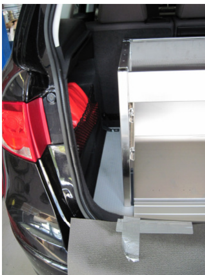
Zugriff Seitenfach rechts