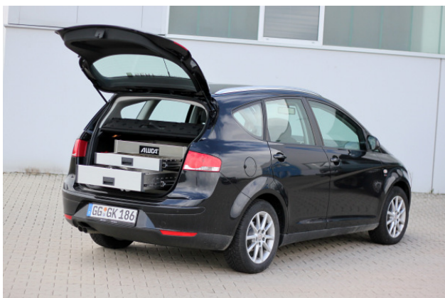
100% Vollauszug auf Teleskopschienen