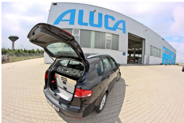
Einbau bis zur Laderaumabdeckung