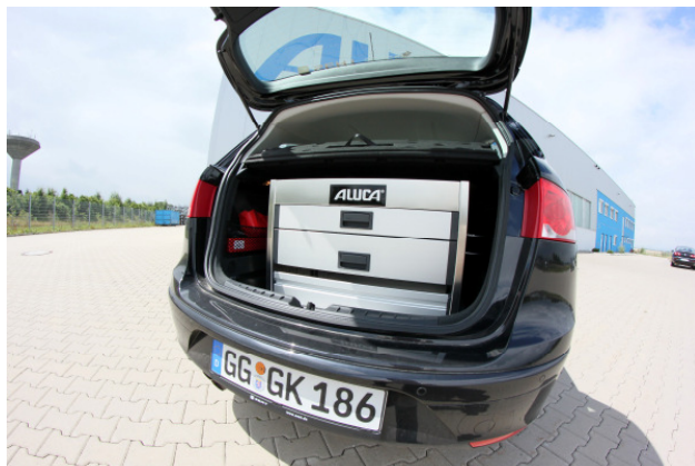
vor Einsicht geschützt